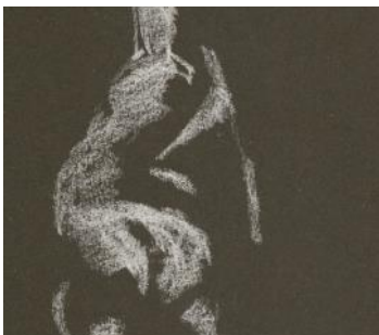
Vi värmer upp med korta krokier innan den långa ställningen.

Modellen står mellan 10:00–16:00 med pauser och lunchrast. Modellen, Jonas, inleder varje dag med korta krokier i en halvtimme till en timme. Därefter bestäms en längre ställning. Vi bestämmer på plats hur lång den blir. Dock minst 1 timme och som mest samma ställning båda dagarna.