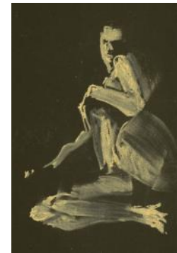
Innan den längre ställningen gör vi korta krokier för att värma upp.

Dörren ska vara stängd vilket betyder att du ringer till någon därinne som kan släppa in dig.