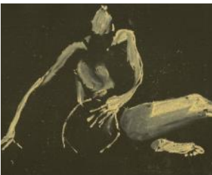
Vi värmer upp med korta krokier innan den långa ställningen.

Ta med det du behöver: stol, bord och staffli. I lokalen finns inga möbler. Dessutom dina målar—och/eller ritgrejor förstås och 200 kronor /dag till modellen.